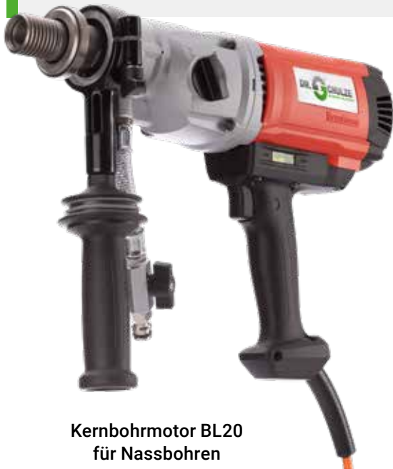
Kernbohrmotor BL20 für Nassbohren

Der neu integrierte Kickback-Stop als aktive Sicherheitsfunktion erkennt ein gefährliches bzw. unkontrolliertes Verdrehen der Maschine und stoppt den Motor sofort. Dadurch wird das Verletzungsrisiko deutlich reduziert.