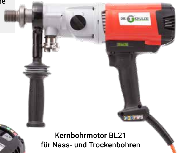
Kernbohrmotor BL21 für Nass- und Trockenbohren